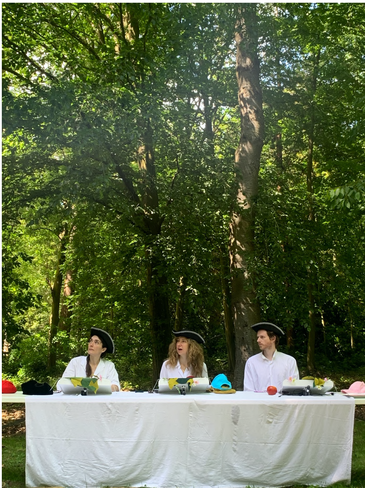
Théâtre de verdure de l'Arboretum d'Harcourt